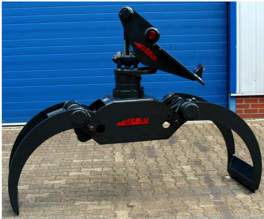
KHF13.22 mit SW-Adaption SKL10